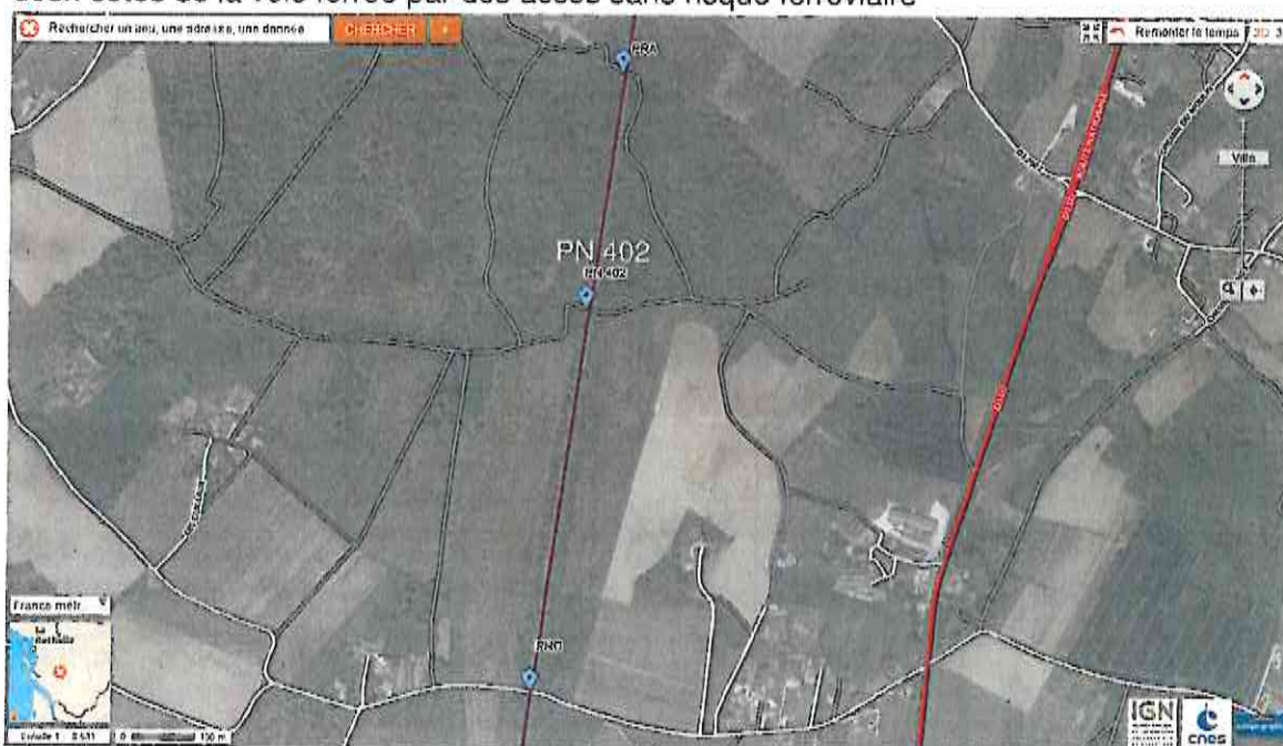
Situation du PN 402

Le PN 402 se trouve à proximité d'un pont route et d'un pont rail permettant d'accéder aux deux côtés de la voie ferrée par des accès sans risque ferroviaire