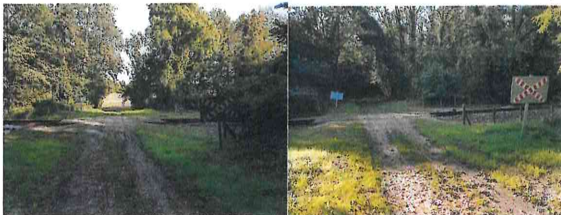
Vues à partir du chemin, côté Est et côté Ouest